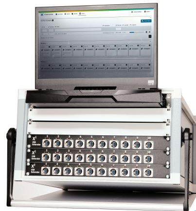
X5 Multi Modu Beispiele