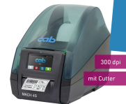
Erweiterbar um Lable Drucker